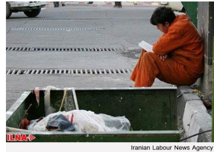
Iranian Labour News Agency

به گزارش خبرگزاری دولتی ایلنا، ۱۲ دی ۱۳۹۶ آمده است: حدود دویست کارگر شهرداری زابل در استان سیستان و بلوچستان، سه ماه مطالبات مزدی پرداخت نشده دارند. آنان می گویند: تاخیر در پرداخت مزد کارگران شهرداری زابل/ پاکبانان: جایی نمانده که مقروض نباشیم این کارگران بارها به شهرداری و شورای شهر مراجعه کرده اند ولی تاکنون هیچ مرجعی پاسخگوی آنها نبوده است. یکی از این کارگران می گوید: بیشتر پاکبانان و کارگران خدماتی شهرداری، مستاجر هستند؛ در بی پولی فعلی، نه تنها در پرداخت اجاره خانه هایمان درمانده ایم؛ بلکه به همه کسبه و اهالی محل مقروضیم؛ حتی به نانوائی ها. این کارگر ادامه می دهد: مقامات و مسئولان، کمبود بودجه را بهانه می کنند و می گویند باید باز هم صبر کنید؛ این در حالیست که هیچ راهی برای تامین مخارج یومیه خانواده نداریم.